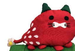
いちごの森マスコット ベリにゃん

品種構成 : 熊本県育成品種「ゆうべに」の他、 さかほのか、紅ほっぺを食べることができます!